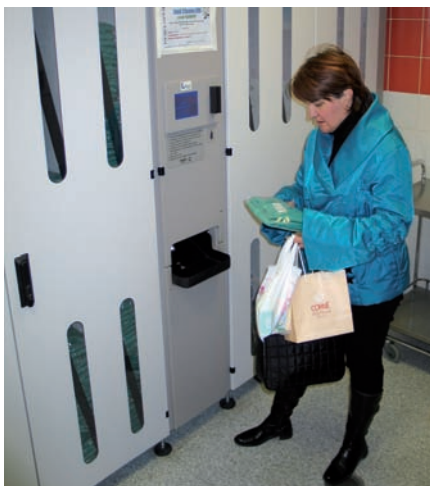
Le distributeur avec ses hublots permettant de vérifier le stock de vêtements disponibles

« Pour faire face aux ruptures de stock, les personnels faisaient des stocks tampons de sécurité dans leur placard. Cela avait pour effet d'amplifier le phénomène, et faisait séjourner les tenues plusieurs jours voir semaines dans des casiers qui contiennent aussi les effets personnels ce qui n'était pas satisfaisant », précise Mme Pouradier, responsable des achats.